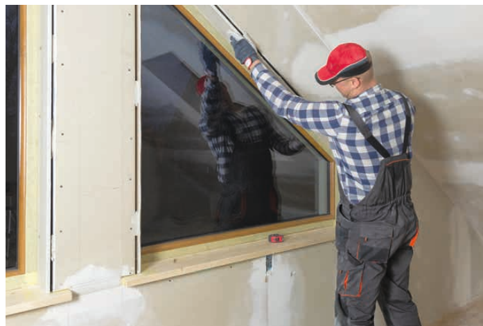
Fachgerechte Montage ist entscheidend: Nur korrekt eingebaute und abgedichtete Fenster können ihre Vorteile bei Wärmedämmung, Schallschutz und Energieeffizienz dauerhaft entfalten.

Bauelemente für Komfort und Energieeffizienz