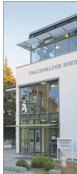
BRUSTKREBS UND REKONSTRUKTION

Auch im Bereich Inkontinenz wendet die Frauenklinik Rheinfelden in den meisten Fällen diese fortschrittliche Technik an. Betroffen von ungewolltem Urinabgang sind vor allem ältere, aber auch jüngere Frauen nach einer Schwangerschaft.